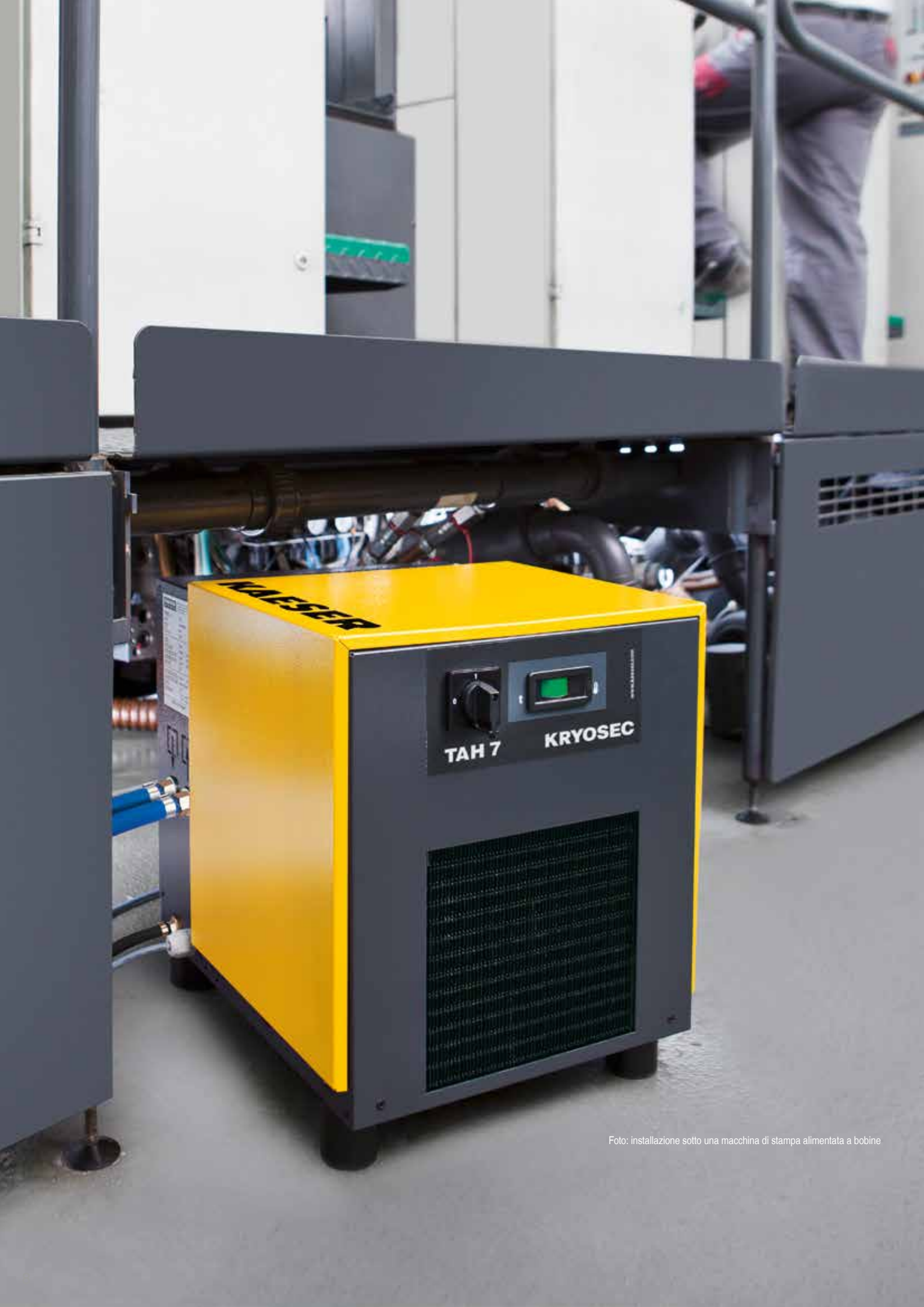
Foto: installazione sotto una macchina di stampa alimentata a bobine