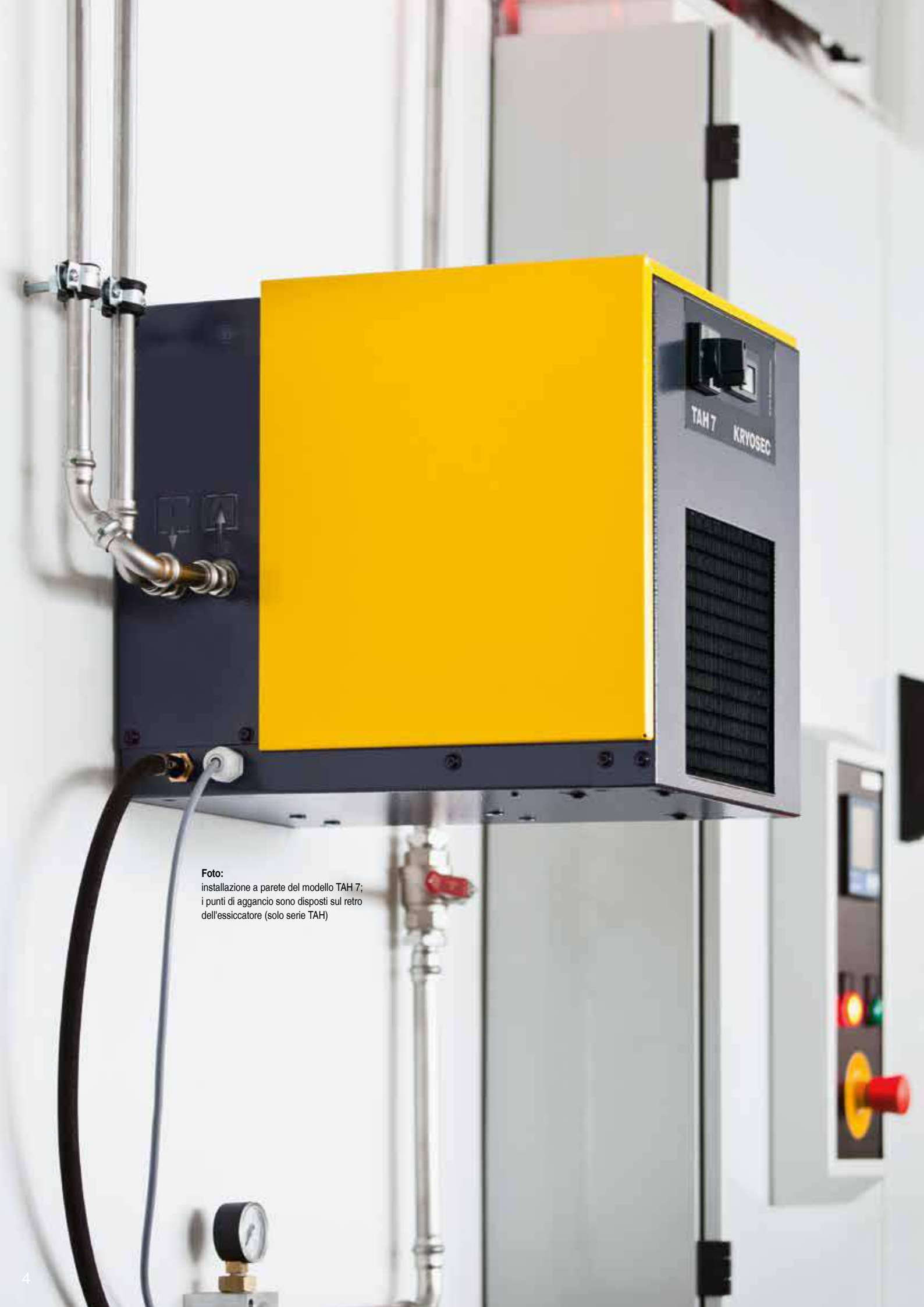
Foto: installazione a parete del modello TAH 7; i punti di aggancio sono disposti sul retro dell'essiccatore (solo serie TAH)