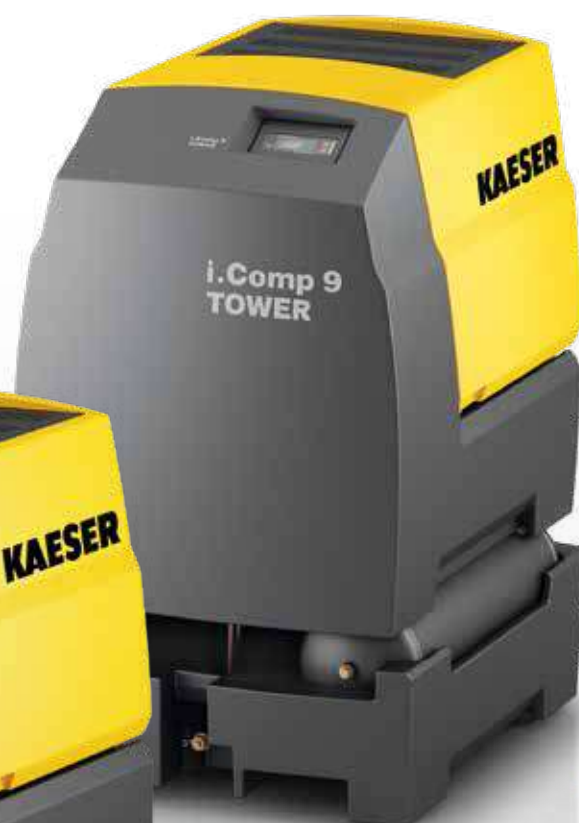
i.Comp 9 TOWER