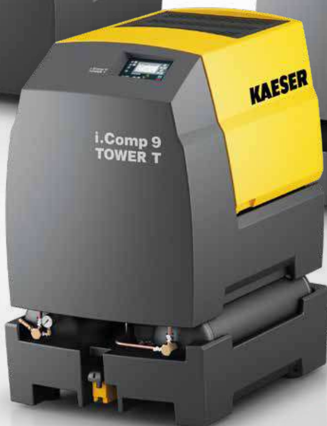
i.Comp 9 TOWER T