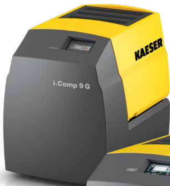
i.Comp 9 G